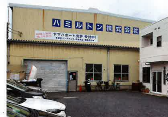
▲ 高度な技術力のもと創造的なモノづくりが行われる自社工場。

に描いたとおりになる」「手の切れるような製品をつくる」「常に創造的な仕事をする」「現場主義に徹する」などの項目があります。8年前から朝礼時にフィロソフィを一読する活動を行っています。その日の担当者がひと項目を朗読し、自らの考え方や体験を発表します。それをみんなでフィードバックする。言わば現場作業の実体験「働く人の道しるべ」を短い時間で共有します。仕事や人生において哲学や信念はとても大切です。困難を乗り越える原動力と考えています。この勉強会を実施して以降、退職者も減り、モチベーションが上がり、顧客からも常に高い評価をいただいています。「なぜ働くのか」「生き方」など、人生の哲学を毎日一緒に働く先輩や仲間と教え合い学び合う。仕事への思いやりや考え方、人生訓を伝える企業文化が重要と考えています。