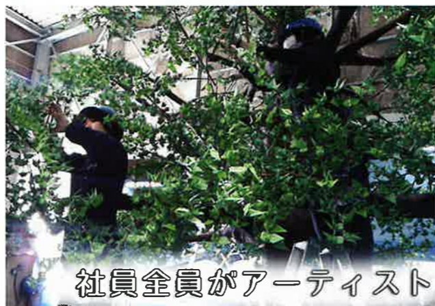
▲商業施設内の大きな大樹!葉っぱを全て折り鶴で飾っています