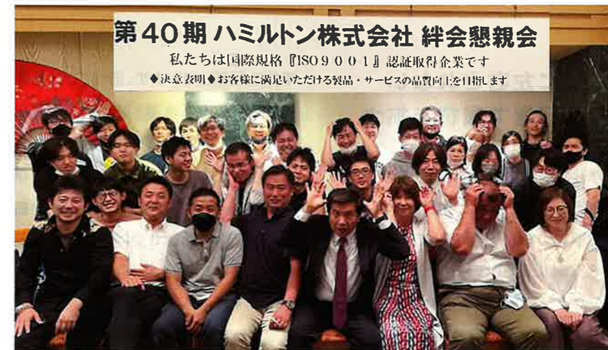
▲ テーマパーク大好き集団。フィロソフィーの共有で結束は一層強固になった。