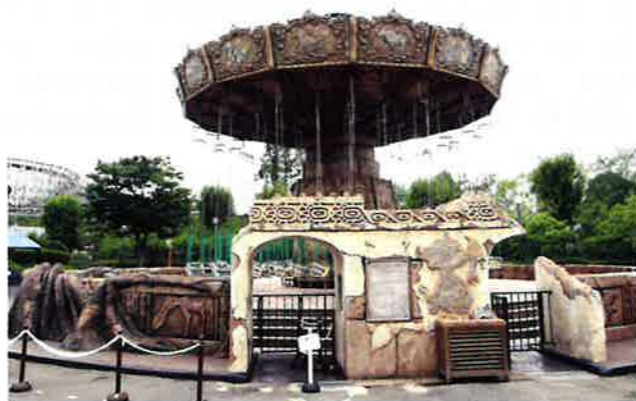
▲ゴットスインガーのモルタル造形・特殊エイジング塗装です

具体的には建築設計の3DソフトRevit、最新3Dハンドスキャナー、超性能の大型高速5軸NCルータを活用し最先端の感性とスピードでお客様の多様なニーズに応えてまいります。